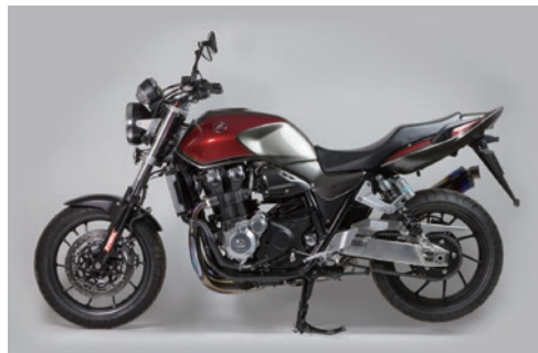
ダイノテストと実走行テストで、様々なライディングフィールドのセッティングデータをチャート化し仕様を決定しています。

ダンピングにワイドな調整幅を持たすことで、ストリート からワインディングまで幅広いシチュエーションで最適な特性を得ることが可能に。