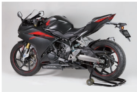
ダイノテストと実走行テストで、様々なライディングフィールドのセッティングデータをチャート化し仕様を決定しています。

純正フォークでは片側にしかダンパー機能がなく、減衰力調整機能、プリロード調整機能がないものを採用する CBR250RR。スポーツ走行を意識した足回りになっているが、プリロード不足で接地感を感じにくく、ストローク中盤と終盤での減衰力の差が大きいためフルブレーキング時にはストローク終盤で突然止まる感じがある。そこで、Technix では CBR250RR 用の TASC キットを新たに開発。積層シム型バルブシステムを用い完全カートリッジ化を図る。片側をコンプレッションダンパー、もう片方をリバウンドダンパーの左右独立調整式システムに大きく変更。スプリングプリロードアジャスターを追加し、スプリングレートを適正化。ダンピングにワイドな調整幅を持たすことで、ストリートからワインディングまで幅広いシチュエーションで最適な特性を得ることが可能に。