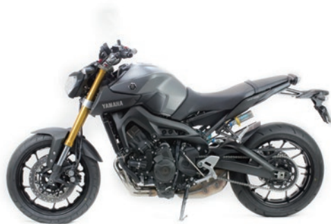
ダイノテストと実走行テストで、様々なライディングフィールドのセッティングデータをチャート化仕様を決定しています。

そこで Technix では TASC キットを MT-09 用に新たに開発。片側をコンプレッションダンパー、もう片側をリバウンドダンパーの左右独立調整式システムに大きく変更。さらにスプリングレートも見直し最適化。ダンピングにワイドな調整幅を持たすことで、ストリートからスポーツ走行までの幅広いシチュエーションで最適な特性を得ることが可能となります。