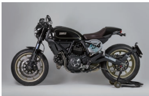
ダイノテストと実走行テストで、様々なライディングフィールドのセッティングデータをチャート化し仕様を決定しています。

純正フォークでは片側にしかダンパー機能がなく、減衰力調整機能、プリロード調整機能がないものを採用する SCRAMBLER Café Racer。初期動作は良いが、ストローク中間も柔らかいため腰がないように感じ、ワインディングなどのスピード域が上がったコーナーでは接地感が感じにくい。そこで、Technix では Ducati SCRAMBLER Café Racer 用の TASC キットを新たに開発。積層シム型バルブシステムを用い完全カートリッジ化を図る。片側をコンプレッションダンパー、もう片方をリバウンドダンパーの左右独立調整式システムに大きく変更し、スプリングプリロードアジャスターを追加。ダンピングにワイドな調整幅を持たすことで、ストリート からワインディングまで幅広いシチュエーションで最適な特性を得ることが可能に。