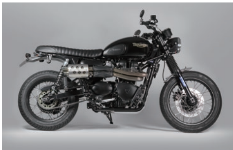
ダイノテストと実走行テストで、様々なライディングフィールドのセッティングデータをチャート化し仕様を決定しています。

純正フォークでは減衰力調整機能がないダンパーロッド式のフォークを採用する Triumph SCRAMBLER。全体の減衰力が弱いため、コーナリング中に安定せず、そのうえストロークを感じづらい。そこで、Technix では Triumph SCRAMBLER 用の TASC キットを新たに開発。スプリングを最適化し積層シム型バルブシステムを用い完全カートリッジ化を図り、片側をコンプレッションダンパー、もう片方をリバウンドダンパーの左右独立調整システムに大きく変更。ダンピングにワイドな調整幅を持たすことで、ストリート からワインディングまで幅広いシチュエーションで最適な特性を得ることが可能に。