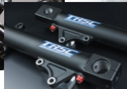
アウターチューブ部の写真は ZRX1200DAEG のものです

TASC for YAMAHA XJR1300 ¥98,000 (税抜) TASCXJR13