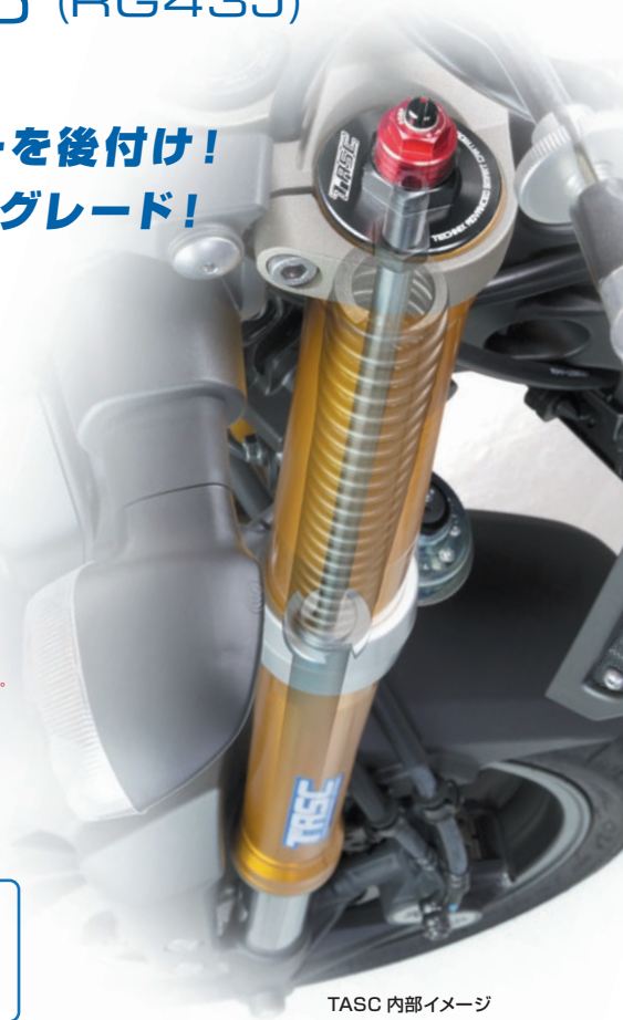
TASC 内部イメージ (写真は MT-09)

TASC for YAMAHA YZF-R25 (RG43J) '19- ¥120,000 (税抜) TASCRCG43J