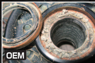
OEMは高圧洗車により内部への泥水の進入が多く、 ベアリングへダメージを与えてしまいます。