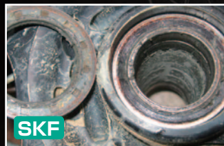
SKFは泥水の進入を最小限に抑え ベアリングへダメージを与えません。

50時間にも及ぶヘビーマディーコンデション化で、 4時間毎に高圧洗車をする過酷なテストで実証されるSKFのパフォーマンス