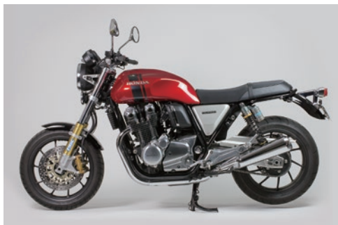
ダイノテストと実走行テストで、様々なライディングフィールドのセッティングデータをチャート化し仕様を決定しています。

純正フォークには減衰力、スプリングプリロード調整機能がないものを採用する CBR1100RS。街乗りなどの中・低速域では減衰力もちょうどよく、しなやかに動くが、ワインディングやサーキット走行などの高速域では一気に奥に入ってしまう傾向があり、コーナリング中に安定しない。そこで、Technix ではフロントフォークの弱点を補うべく TASC キットを CB1100RS 用に新たに開発。スプリングレートを適正化し、積層シム型バルブシステムを用い完全カートリッジ化を図る。片側をコンプレッションダンパー、もう片方をリバウンドダンパーの左右独立調整式システムに大きく変更。ダンピングにワイドな調整幅を持たすことで、ストリートからスポーツ走行まで幅広いシチュエーションで最適な特性を得ることが可能に。