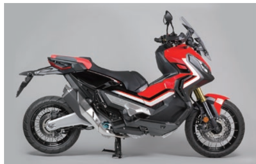
ダイノテストと実走行テストで、様々なライディングフィールドのセッティングデータをチャート化し仕様を決定しています。

純正フォークの減衰力調整はリバウンド側（伸び側）のみの調整機能になり、コンプレッションアジャスター（縮側調整機能）がないフォークを採用する X-ADV。プリロード量が少ないため 1G での沈み込み量も多くなり、有効ストロークが少なく、減衰力も不足しているため接地感が感じづらい。またブレーキングでは奥でストロークが止まるような感じが思い切ったライディングができない。そこで、Technix ではフロントフォークの弱点を補うべく TASC キット X-ADV 用に新たに開発。スプリングレートを適正化し、積層シム型バルブシステムを用い完全カートリッジ化を図る。片側をコンプレッションダンパー、もう片方をリバウンドダンパーの左右独立調整式システムに大きく変更。ダンピングにワイドな調整幅を持たすことで、ストリートから林道走行まで異なるシチュエーションで最適な特性を得ることが可能に。