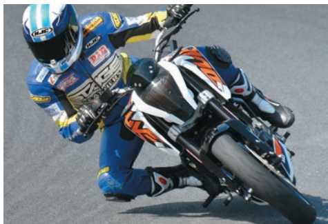
ダイノテストと実走行テストで、様々なライディングフィールドのセッティングデータをチャート化し仕様を決定しています。

そこで、Technix ではフロントフォークの弱点を補うべく TASC キットを DUKE/RC 用に新たに開発。スプリングレートを適正化し、積層シム型バルブシステムを用い完全カートリッジ化を図る。片側をコンプレッションダンパー、もう片方をリバウンドダンパーの左右独立調整式システムに大きく変更。ダンピングにワイドな調整幅を持たすことで、ストリートからスポーツ走行まで幅広いシチュエーションで最適な特性を得ることが可能に。