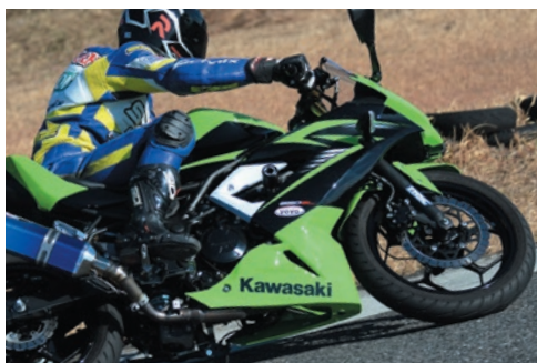
ダイノテストと実走行テストで、様々なライディングフィールドのセッティングデータをチャート化し仕様を決定しています。

そこで、Technixではフロントフォークの弱点を補うべく TASC キットを Ninja250SL 用に新たに開発。調整機能付きトップキャップを組み込むため専用インナーチューブを採用し、スプリングレートを適正化。積層シム型バルブシステムを用い完全カートリッジ化。片側をコンプレッションダンパー、もう片方をリバウンドダンパーの左右独立調整システムに大きく変更。ダンピングにワイドな調整幅を持たすことで、ストリートからスポーツ走行まで幅広いシチュエーションで最適な特性を得ることが可能に。