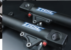
アウターチューブ部の写真は ZRX1200DAEG のものです

TASC for YAMAHA XJR1300 ¥107,800 (税込) TASCXJR13